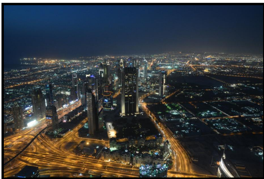
Noční Dubaj z Burj Khalífa z výšky 452 m.